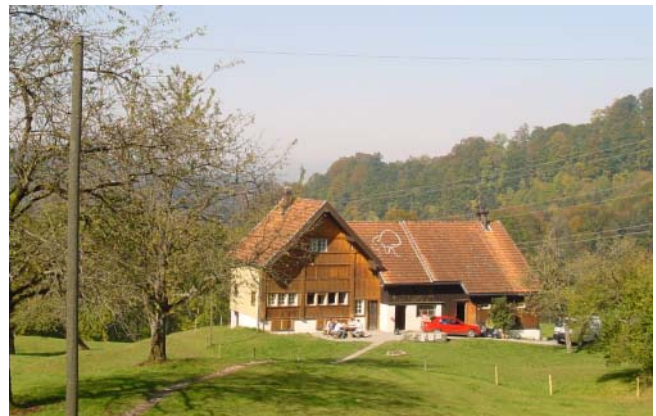
Heimverein Pfadfinder Hospiz St. Gallen

Wir wünschen Ihnen angenehme Stunden im Töbeli und erlebnisreiche Tage im Appenzellerland.