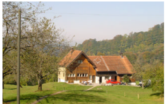
Heimverein Pfadfinder Hospiz St.Gallen Heimverwaltung Töbeli

Wir wünschen Ihnen angenehme Stunden im Töbeli und erlebnisreiche Tage im Appenzellerland.